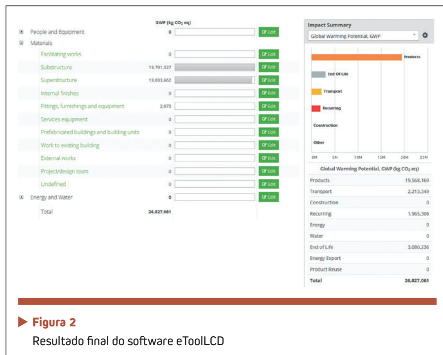
► Figura 2 Resultado final do software eToolLCD

O uso do cimento CP III contribuiu para a diminuição do impacto incorporado do concreto, garantindo a viabilidade dos outros 2 pontos na certificação LEED desta obra.